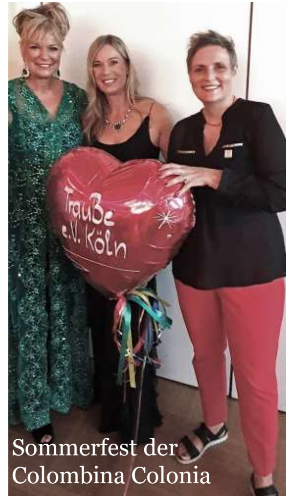
Sommerfest der Colombina Colonia