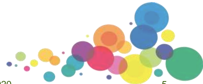
TrauBe Köln e. V. – Mitgliederversammlung 2020